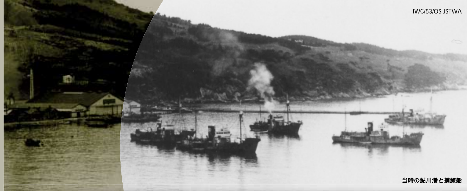
当時の鮎川港と捕鯨船